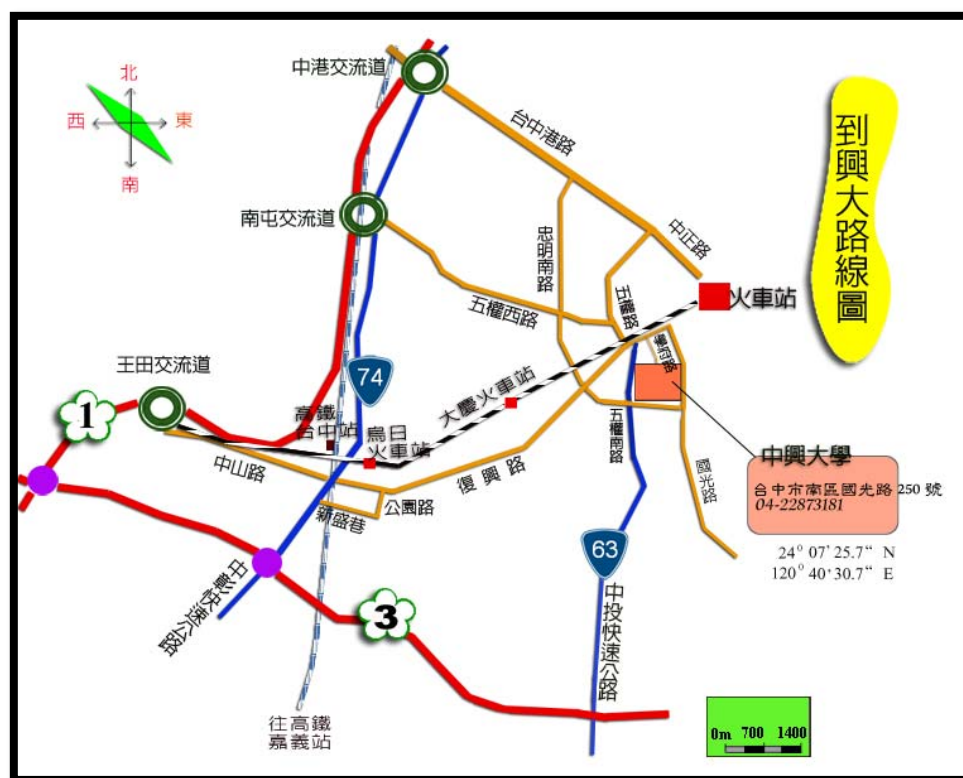
Figure 1 交通路線圖一